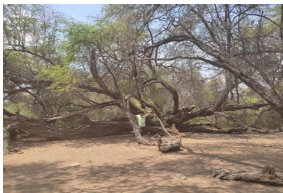
Figura 2: Árbol milenario de algarrobo

Nota. El investigador, posando al lado de árbol milenario, un algarrobo muy antiguo que tiene aproximadamente 300 años de vida está ubicado dentro del Bosque de Pómac, ubicado entre los pueblos de Batan Grande, Pítico y Túcume, pertenecientes al departamento de Lambayeque. La impresión fotográfica no distingue el tronco del árbol milenario, muy por el contrario, muestra una maraña de troncos, esto se debe a que hace 300 años aproximadamente, un solo árbol de algarrobo fue tan frondoso que sus ramas, por el mismo peso, cayeron al suelo (sin desprenderse del tronco principal), estas ramas siguieron creciendo bajo la tierra, convirtiéndose así, en nuevas raíces, que con el tiempo se convirtieron en nuevos troncos de árbol de algarrobo, y así sucesivamente durante todo este tiempo, motivo por el cual, hoy se aprecia una maraña de troncos que en realidad son las ramas de un solo árbol, que en conjunto se le conoce como árbol milenario.