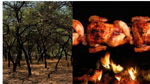
Figura 1: Bosques de algarrobo vs pollo a la brasa

Por ello, el 5 de febrero del mismo año, junto a su socio Franz Ulrich, decide tecnificar poco a poco la producción y crea un restaurante improvisado, La Granja Azul , que ofrece platos de pollo a la brasa. El lema en medio de la Carretera Central en la década de 1950 decía: Coma todo el pollo a la brasa que quiera por 5 Soles , marcando el comienzo del negocio del pollo a la brasa en Lima (Yeshayahu, 2020).