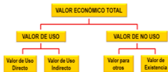
Figura 3: Valor Económico Total