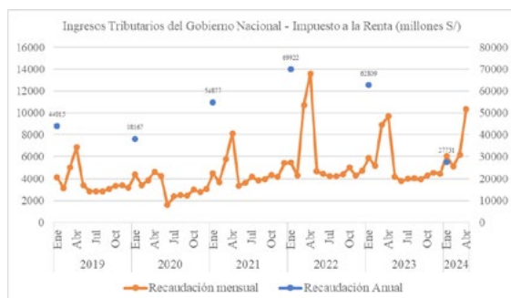
Figura 2: Ingresos tributarios del Gobierno Nacional por el concepto del Impuesto a la Renta del 2019 hasta abril del 2024

Nota: Datos extraídos del Banco Central de Reserva del Perú (BCRP)