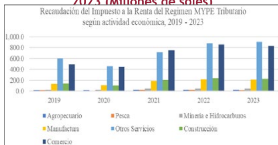
Figura 4: Impuesto a la Renta régimen MYPE Tributario según actividad económica 2019-2023 (Millones de soles)

Nota: Datos extraídos de la Superintendencia Nacional de Aduanas y administración Tributaria (SUNAT)