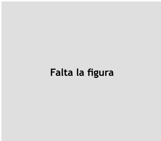
Figura 1. Procedimiento para la gestión por procesos

Nota. Adaptado de Negrín y Medina (2003), Hernández et al. (2013), Hernández et al. (2016).