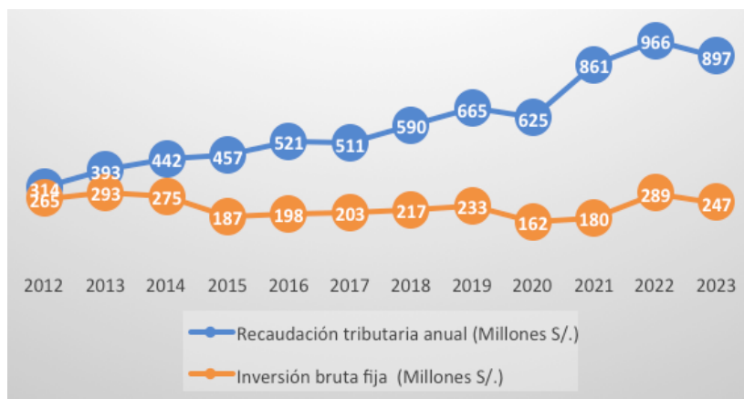
Recaudación tributaria e inversión pública en la región Ucayali, 2012-2023

Nota. Elaboración propia con información del INEI y BCRP.