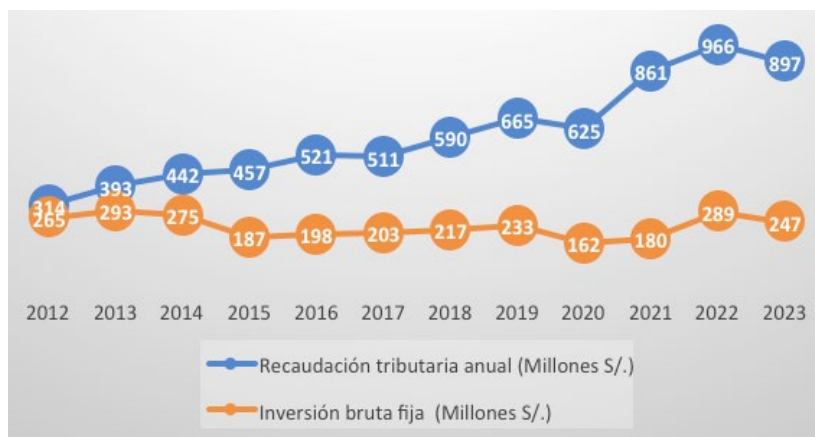
Recaudación tributaria e inversión pública en la región Ucayali, 2012-2023

Nota. Elaboración propia con información del INEI y BCRP.