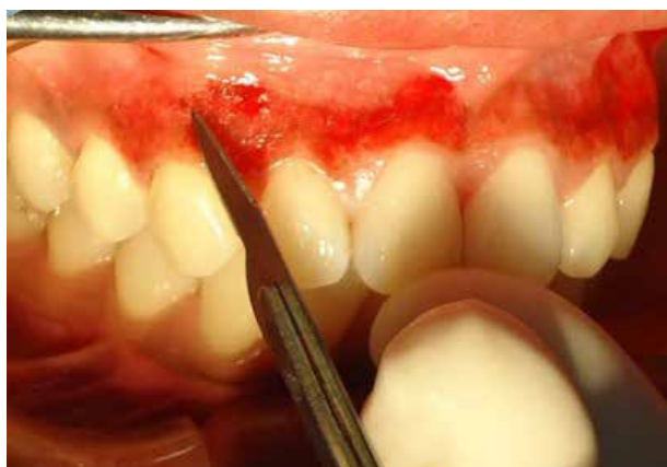
Figura 4. Raspado superficial con bisturí.