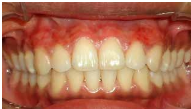
Figura 6. Posoperatorio: 2.º día