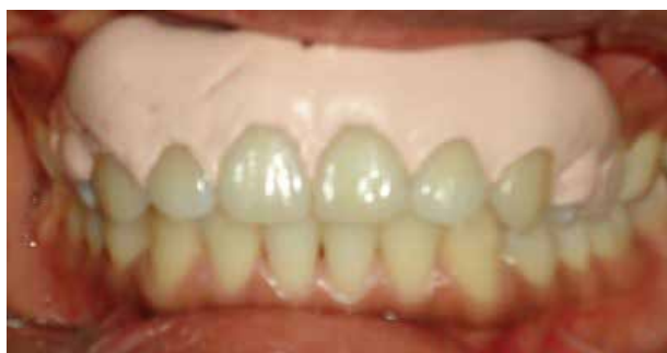
Figura 5. Colocación de apósito periodontal.