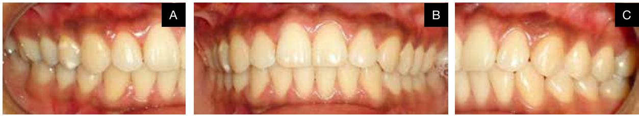
Figura 1. A. Preoperatorio derecho B. Preoperatorio frente C. Preoperatorio izquierdo