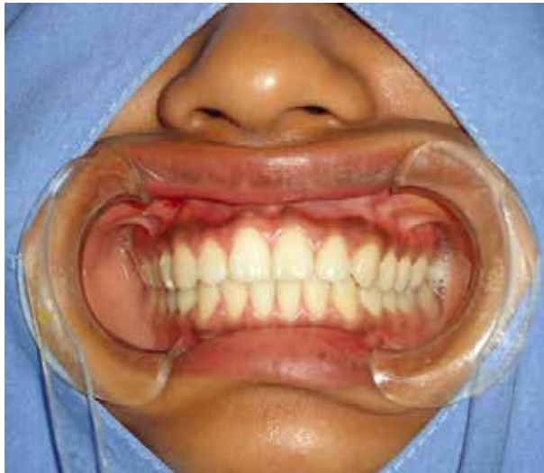
Figura 2. Colocación de separador de comisuras labiales