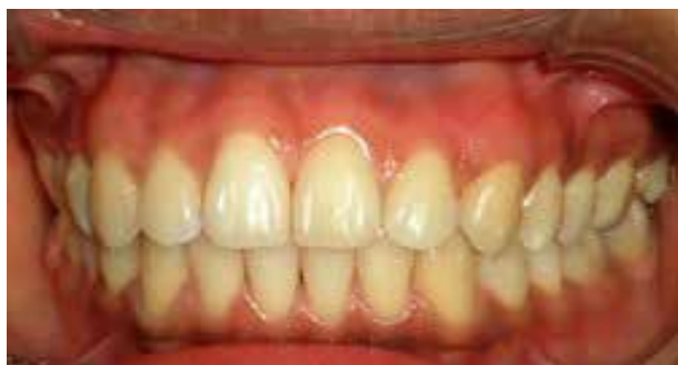
Figura 7. Posoperatorio: 8.º día

Primer control: al segundo día, donde se evidencia un estado óptimo de la zona tratada en franca regeneración y se retira el apósito periodontal.