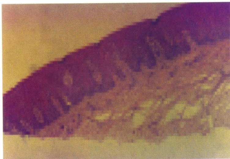
Fig. Nº 2: Mucosa palatina de paciente edéntulo, después de usar prótesis completa. Muestra: grosor de epitelio de 196.70 micras con queratinización incompleta y grosor de capa córnea de 11.82 micras. H.E. 100 X.

capa córnea se muestra más gruesa. La queratinización de la mucosa masticatoria palatina observada fue de tipo completa (ortoqueratinización) en un 83.33% de los casos estudiados.