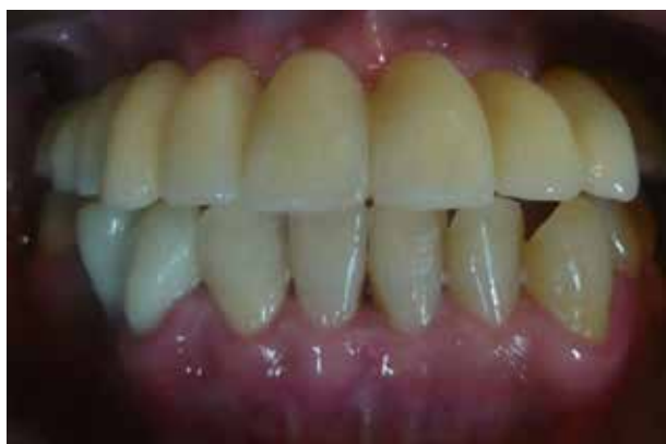
Figura 20. Preparación de la prótesis soportada del maxilar superior