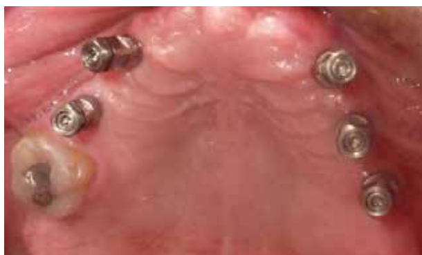
Figura 18. Preparación de los transferes para realizar la impresión con cubeta abierta