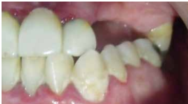
Figura 3. Vista intraoral izquierda se observa sarro dentario, inflamación de la encía y ausencia de piezas dentarias