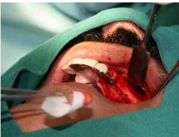
Figura 11. Se optó por emplear membrana de colágeno de origen bovino (GenDerm®), en forma de cono, en el lecho óseo