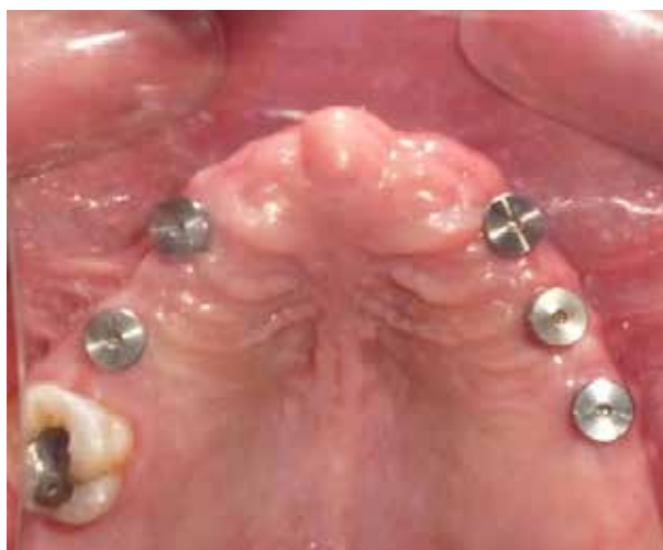
Figura 17. Colocación de los tornillos de cicatrización