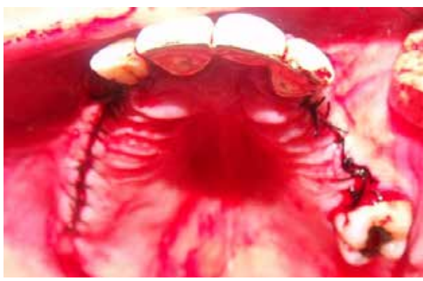
Figura 15. Se sutura el colgajo afrontando los bordes sin tensión para promover una cicatrización por primera intención; en el sector derecho se realiza sutura continua y en el sector izquierdo puntos simples con hilo seda negra 4/0

Se discutieron diversas opciones de tratamiento y se estableció el siguiente: instrucción de higiene bucal con evaluación y reforzamiento de control de placa, profilaxis bucal, raspado y alisado radicular para remover la placa supra y subgingival (Figura 5 a 7). No requiere terapia combinada antimicrobiana. Posteriormente, al logro de la remisión de la enfermedad se realizó la colocación de implantes dentales como parte de su tratamiento de rehabilitación oral.