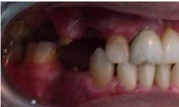
Figura 7. Sector posterior superior e inferior derecho se realizó el raspaje radicular con curetas Gracey 7/8, 9/10, 11/12 y 13/14 para eliminar cálculos presentes en las caras libres y proximales de los dientes, asimismo, la realización de exodoncias de los remanentes radiculares