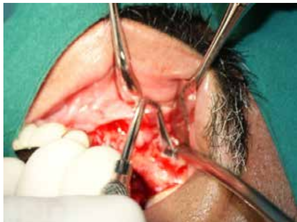
Figura 10. Se desprende la mucosa antral con las curetas propias del levantamiento de seno, apoyados con la cureta molt