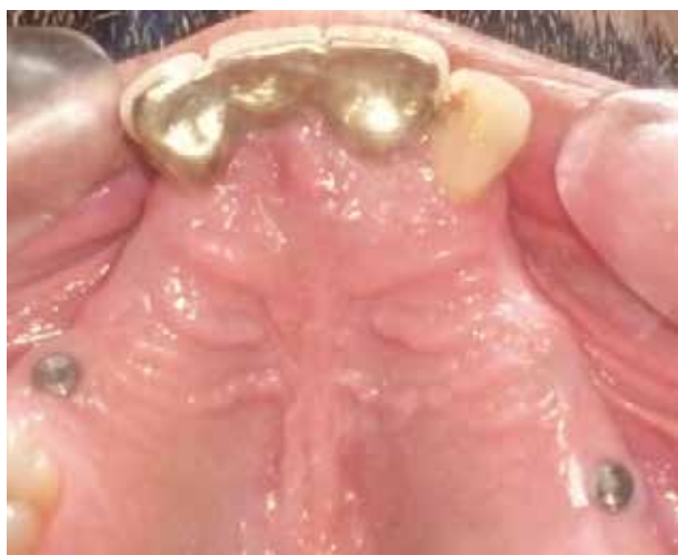
Figura 16. Imagen posoperatoria después de seis meses de realizada la cirugía