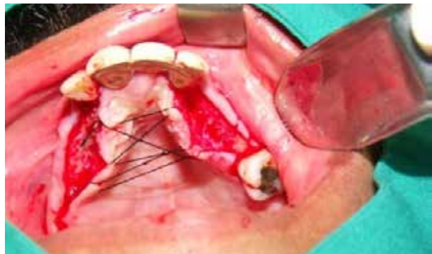
Figura 8. Incisión paracrestal con la colocación de hilo de reparo a nivel del rafe medio, para tener una mejor visualización del campo operatorio.