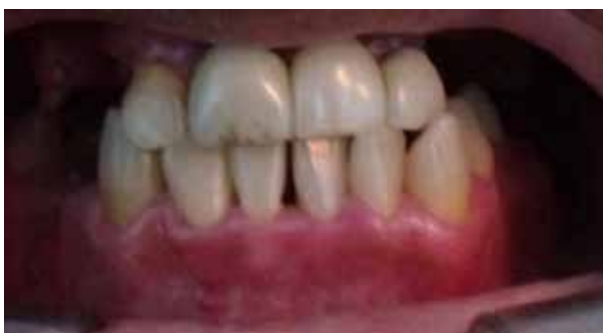
Figura 5. Vista frontal, posterior al tratamiento de raspado y alizado radicular con las curetas Gracey anterior 1/2, 3/4 y 5/6