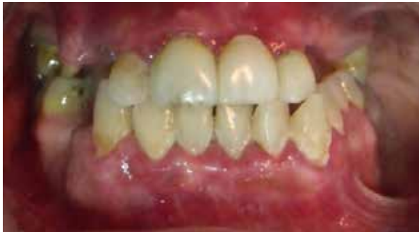
Figura 1. Vista frontal, se observa la presencia de cálculos dentarios supragingivales, inflamación en el sector anterior tanto en el maxilar superior como inferior, presencia de prótesis fija anterosuperior con filtración

El control médico realizado no arrojó ninguna enfermedad presente; sin embargo; se reportó fractura cerrada única de parasíntesis hace 20 años, se colocaron dos placas de titanio, los antecedentes odontológicos determinaron que el paciente no había recibido indicaciones para el cuidado de la cavidad bucal; revela una inflamación gingival difusa.