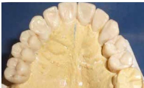
Figura 19. Encerado diagnóstico del modelo