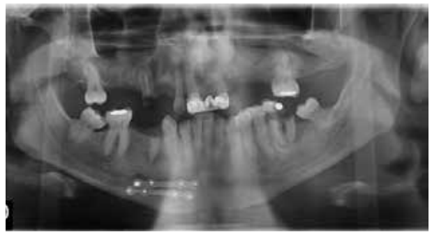
Figura 4. Examen radiográfico. Revela pérdida ósea generalizada en el maxilar superior de moderada a severa, de forma vertical, siguiendo un patrón simétrico. Piezas remanentes con procesos periapicales crónicos