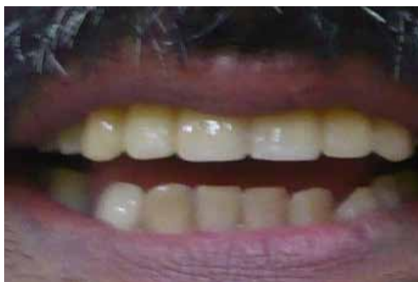
Figura 21. Sonrisa final del paciente

postulados de Socransky. En estos se consideran los siguientes puntos: