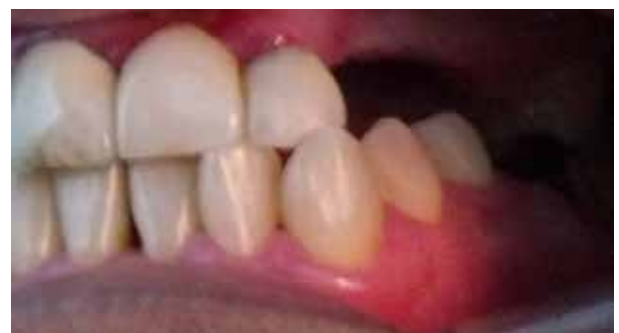
Figura 6. Sector posterior superior e inferior izquierdo, se realizó el raspado radicular con curetas Gracey 7/8, 9/10, 11/12 y 13/14 para eliminación de cálculos infragingivales. Exodoncias de los remanentes radicales