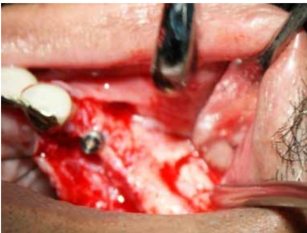
Figura 9. Se realiza una antroplastia bilateral; lado izquierdo de aproximadamente 1 cm de diámetro en la pared lateral del seno con una fresa redonda de carburo de tungsteno de tamaño grande para delimitar el acceso quirúrgico