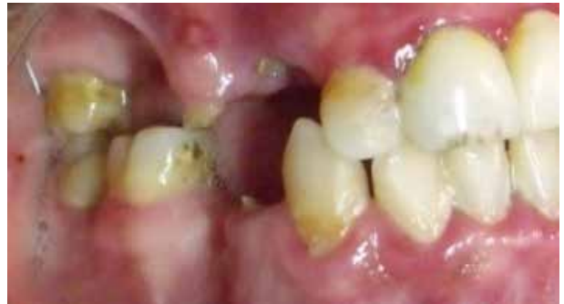
Figura 2. Vista intraoral lateral derecha, se observa la presencia de remanentes radiculares e inflamación de las encías marginales del sector posterior, asimismo, la presencia de un colapso oclusal posterior