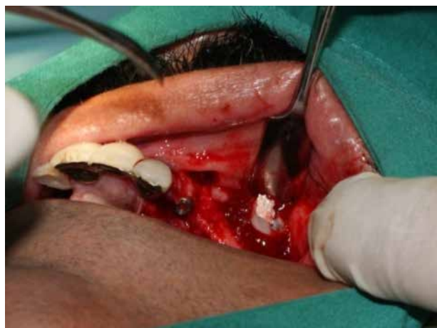
Figura 12. Posteriormente, se aplicó dentro del cono de membrana de colágeno el hueso bovino liofilizado (GenOx Org®)