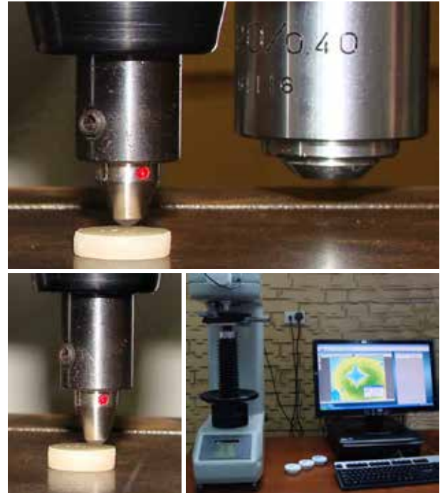
Figura 3: Indentación Vickers.

Luego de realizar la conversión de micras a \text{kg}/\text{mm}^2 , se procedió al vaciamiento de la información en la ficha de recolección de datos.