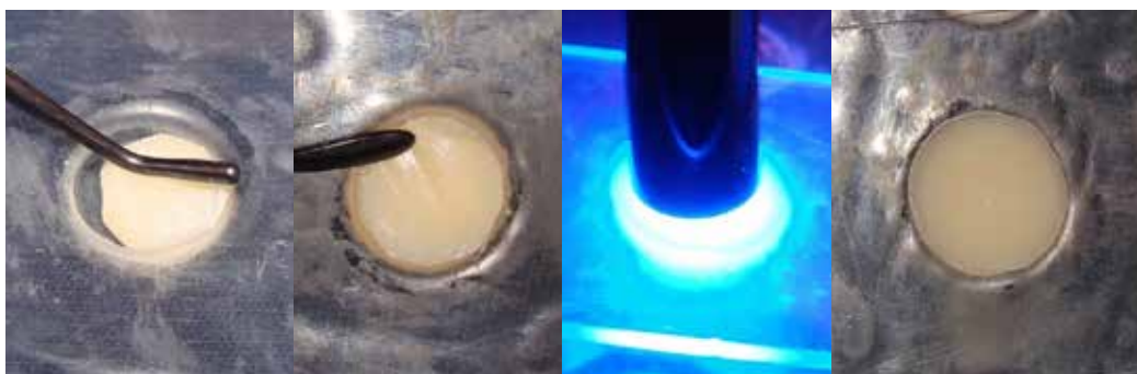
Figura 1: Confección de los bloques de nanopartículas.