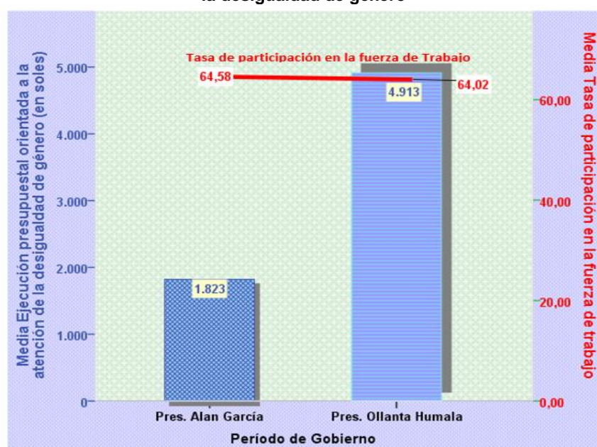
Gráfico 2 Tasa de participación en la fuerza de trabajo y ejecución presupuestal orientada a la desigualdad de género