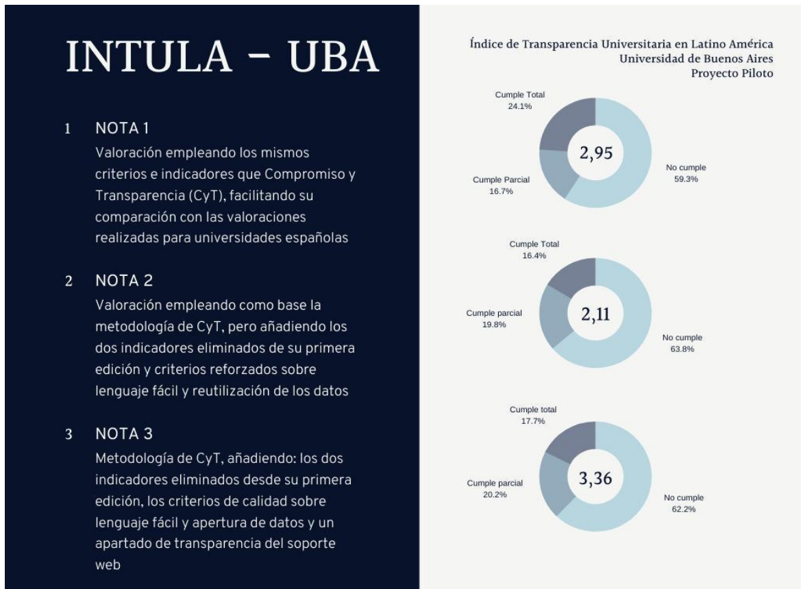
Figura 2. Representación gráfica de los resultados del INTULA para la UBA