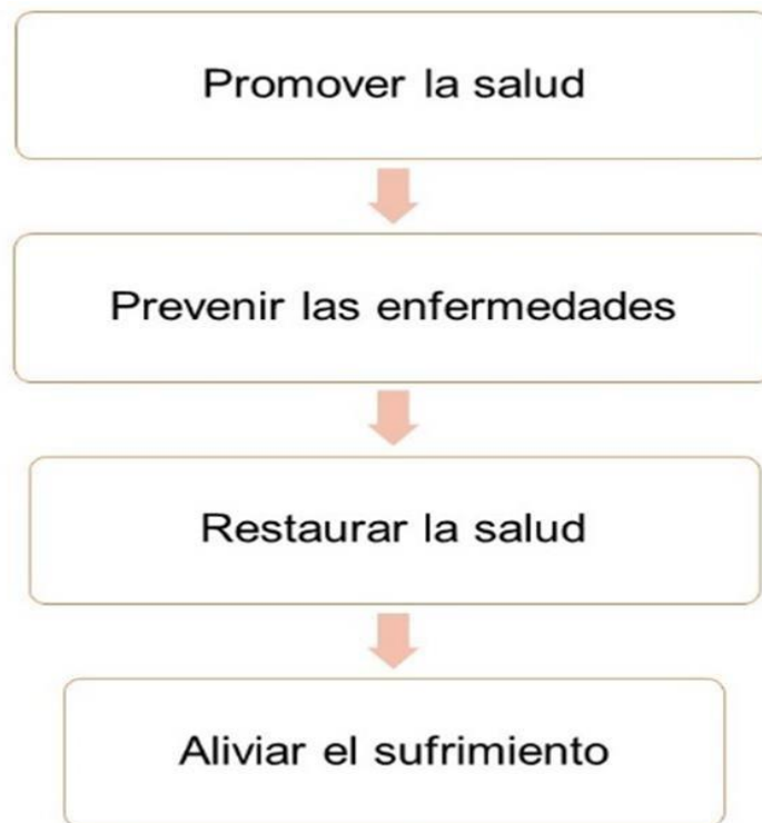
Figura 1. Niveles de prevención en enfermería.